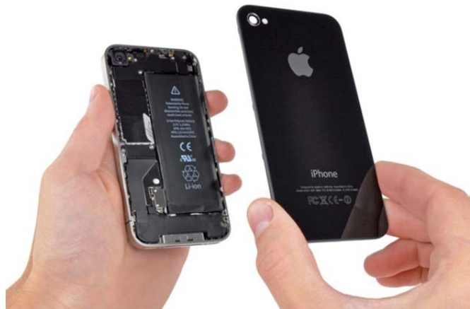
Fig 2: Batteriskifte/Battery replacement for iPhone 4S.

Additional comment: Battery replacement in the Apple 4S is greatly simplified, as Apple has, in retrospect, realized that this was a structural weakness. See Figure 2.