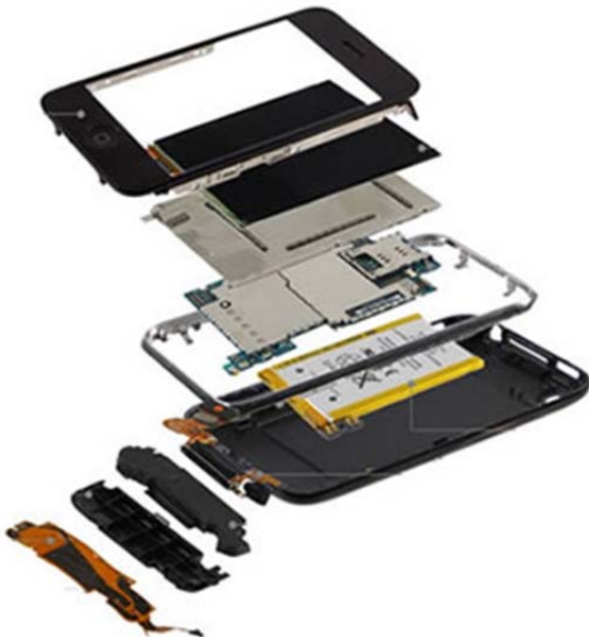
Fig 1: Sammenstilling av/Assembly of iPhone 3G S.

Background information for question a): Figure 1 shows the tear down of the iPhone 3G S, where one can see that the battery is located at the bottom inside of the phone's housing, so that the entire phone must be dismantled to replace the battery. The designers have probably had good reasons for such a design, but the result is that it will be complicated and expensive to replace a defective battery, which is a Li-ion battery that has a typical lifespan of 3-400 charges or about 2 years of normal use. Maybe a bit exaggerated, we can say that the iPhone 3G S is not profitable to repair when the battery is worn out, giving the phone a typical lifetime of 2 years.