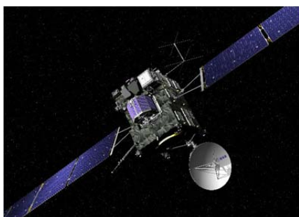
Fig 3: A picture of the space sonde "Rosetta" sonde / Et bilde av romsonden "Rosetta"